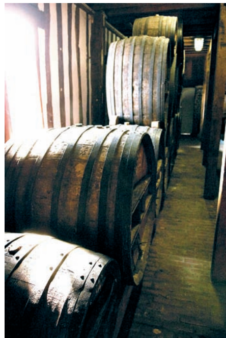
Ohne Reifezeit kein Calvados - mindestens ein Jahr muss der zweite Apfelbrand im Eichenfass ruhen, um Calvados genannt werden zu dürfen.