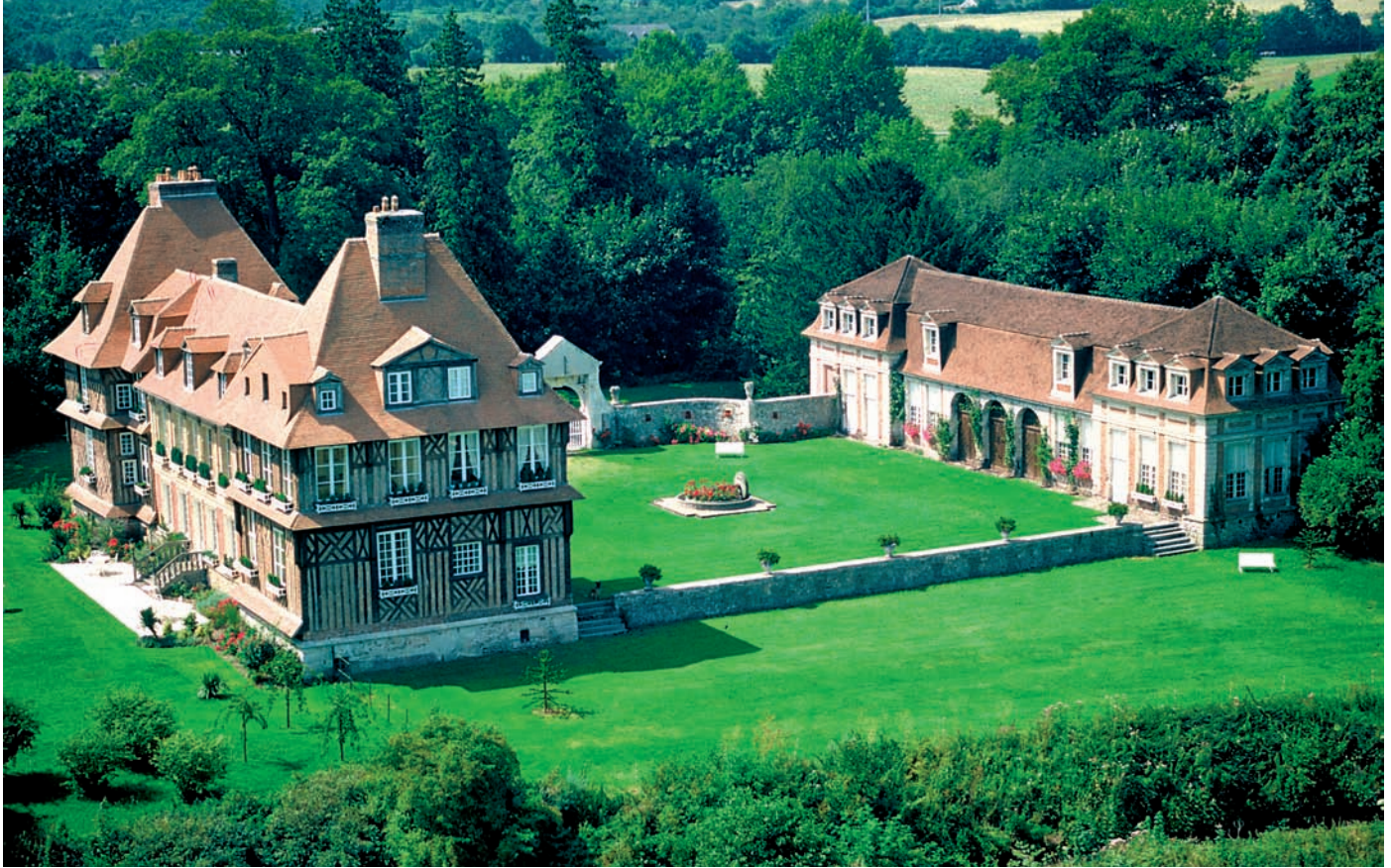
Das herrschaftliche Anwesen des Chateau de Breuil - einer der wenigen Calvados-Produzenten aus der Pays d'Auge, der auch bei uns zu haben ist.

„Alambic“ in der Nacht aufpasst. Der Hof und die riesigen Keller, die eigentlich Scheunen sind, verströmen spürbar den Charme vergangener Zeiten. Hier ruhen die Brände in riesigen, fast hundert Jahre alten Eichenfässern, die bis zu 143 Hektoliter fassen, und man ahnt rund um diese schwarzgrauen ovalen Riesen ein Paradies von Spinnweben. Kleiner mit ca. 500 bis 1.000 Liter Fassungsvermögen werden die Fässer erst, wenn man den bereits alten Tropfen die letzte Ruhestätte gibt, bevor sie für gut befunden werden, als die Spitzenqualitäten „Reserve de Semainville“, „Reserve d'Adrien“ und „Prestige Camut“ abgefüllt zu werden.