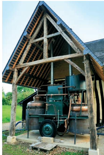
Sie ist in Frankreich eine Berühmtheit: die fahrende Brennanlage des Pierre Pivet, heute immer noch im Einsatz für den „Coeur de Lion“.