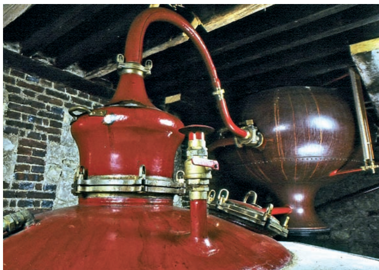
Blick auf die „Alambic“ von Dupont - eine traditionelle Brennanlage mit einigen Besonderheiten, kurz gefasst als „Methode der Charente“ benannt.