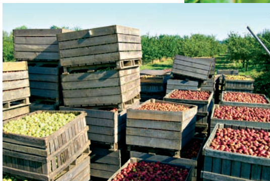
Die Ernte der Äpfel - schon hier beginnt bei Dupont der Qualitätsprozess mit wenigen ausgewählten Apfelsorten.