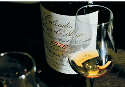
Herausragende Qualität: Eine Vintage 1976 aus der Pays d'Auge von Christian Drouin